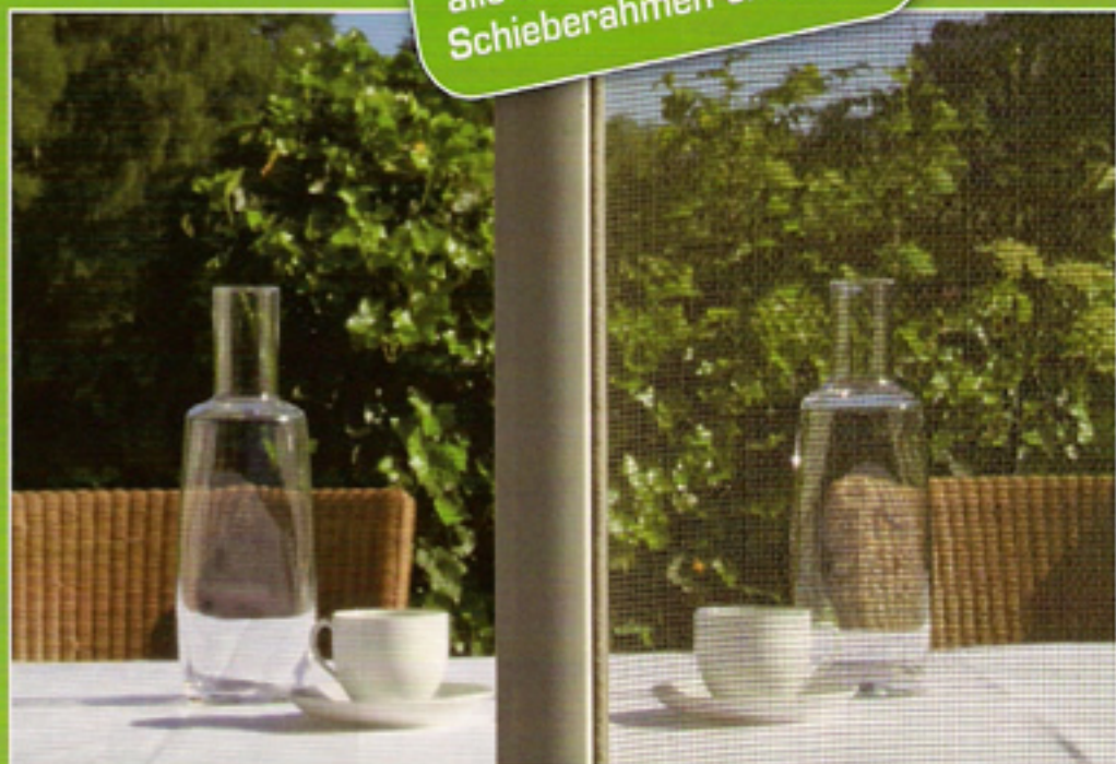
mit 4PLUS Insektenschutz Gewebe

Das 4PLUS Gewebe ist optional AB SOFORT für alle IGI Spann-, Dreh- und Schieberahmen erhältlich!