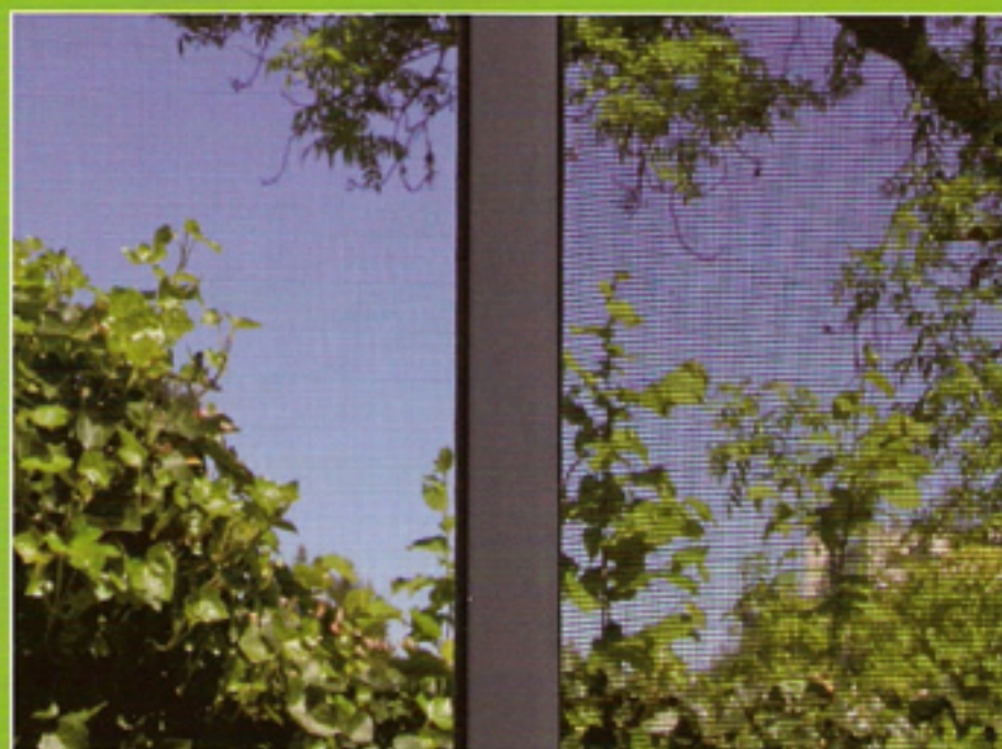
mit 4PLUS Insektenschutz Gewebe